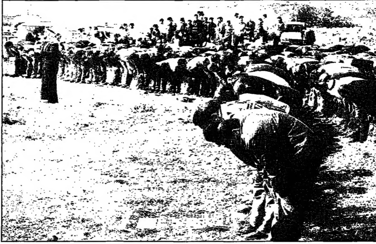
مئات الفلسطينيين يؤمنون الصلاة على ارض صادرتها اسرائيل في طراكم (رويت)

الخليل - رويترز - في مدينة الخليل يقيمون على ارض صادرتها اسرائيل منذ عام 1979... واليهود يترشقون بالخضار والبيض في الجزء المحتل من المدينة مستوطنون يهدمون منزلا عربيا في مدينة الخليل الفلسطينيين يقيمون الصلاة على ارض اختجاجا على مصادرتها